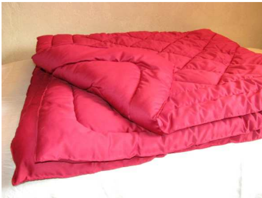
Couverture piquée 2 places