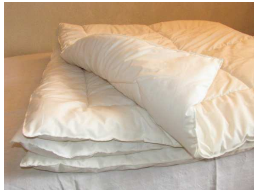
Couette 2 places